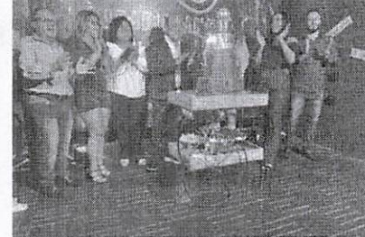
O famoso "Parabéns a Você" entre seus familiares