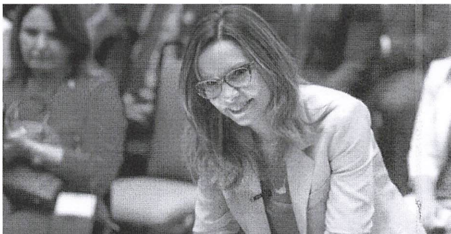
Mulher da Assembleia na luta pelos direitos das mulheres maranhenses.

“Temos a maior bancada feminina da história e a primeira mulher eleita e reeleita para presidir o Parlamento Estadual, mas precisamos de muito mais representação na política. Por isso, enfatizo sempre que, quando somente uma mulher entra na política, muda a mulher. Mas quando várias mulheres entram na política, podemos mudar a política. É com esse foco que vamos conduzir nosso trabalho”, enfatizou. Em seu pronunciamento, a chefe do Parlamento Estadual destacou a importância da Procuradoria da