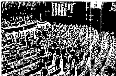
Senado e Câmara promovem sessão conjunta, nesta terça-feira (10), para votar projetos de lei e vetos do presidente Jair Bolsonaro

O primeiro dos dez vetos presidenciais a serem analisados pelos deputados e senadores, na Sessão do Congresso desta terça, é o veto total ao Projeto de Lei 3055/17, que aumenta o limite de renda per capita familiar de quem tem direito ao Benefício de Prestação Continuada (BPC). Pelo projeto aprovado pelo Congresso, o aumento seria de um quarto, limite atual, para meio salário mínimo. Ao vetar esse dispositivo, o governo argumentou que a medida criaria