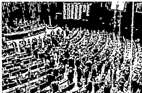
Senado e Câmara promovem sessão conjunta, nesta terça-feira (10), para votar projetos de lei e vetos do presidente Jair Bolsonaro

O primeiro dos dez vetos presidenciais a serem analisados pelos deputados e senadores, na Sessão do Congresso desta terça, é o veto total ao Projeto de Lei 3055/2017, que aumenta o limite de renda per capita familiar de quem tem direito ao Benefício de Prestação Continuada (BPC). Pelo projeto aprovado pelo Congresso, o aumento seria de um quarto, limite anual, para meio salário mínimo. Ao vetar esse dispositivo, o governo argumentou que a medida criaria