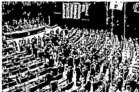
Senado e Câmara promovem sessão conjunta, nesta terça-feira (10), para votar projetos de lei e vetos do presidente Jair Bolsonaro

O primeiro dos dez vetos presidenciais a serem analisados pelos deputados e senadores, na Sessão do Congresso desta terça, é o veto total ao Projeto de Lei 3055/97, que aumenta o limite de renda per capita familiar de quem tem direito ao Benefício de Prestação Continuada (BPC). Pelo projeto aprovado pelo Congresso, o aumento seria de um quarto, limite atual, para meio salário mínimo. Ao vetar esse dispositivo, o governo argumentou que a medida criaria