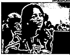
Senadora Eliziane Gama foi escolhida vice-presidente da Comissão, e sugeriu audiências com o novo ministro da Saúde e o ministro da Economia

“Precisamos saber qual é o plano de atuação do novo ministro da Saúde. O que trará a partir de agora. O [Luiz Henrique] Mandetta estava divulgando boletins de atuação diários para a imprensa e queremos saber agora como será esse trabalho, porque