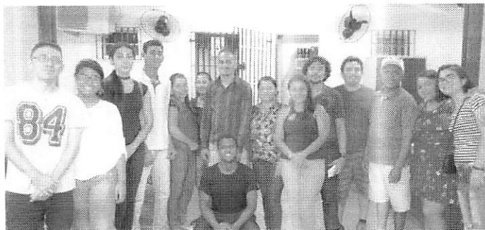
Comissão de Cuidadores Escolares no Sindicato dos Funcionários e Servidores Públicos Municipais de São Luís (Sinfusp)

o princípio de nossas atividades, para que possamos ter dignidade e sermos respeitados como profissionais que somos".