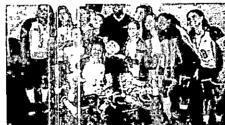
UFMA ficou com título no feminino

O ginásio Manoel Lins foi palco da Liga Cidade de São Luís de Vôlei Sub-23. No torneio feminino, o time da UFMA ficou com a Universidade Federal do Maranhão (UFMA) e venceu a Faculdade Pitagora por 2 sets a 1.