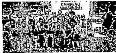
Time do Juventude Timonense