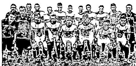
Juventude-Samas tenta reabilitação na Copa Joreme's

A equipe do Juventude-Samas volta a campo nesta terça-feira (21), para enfrentar a seleção de Lago-Açu pela Copa Joreme's Sub-17. Na partida de estreia, o Juventude perdeu de 3 a 2 para São Luís Gonzaga.