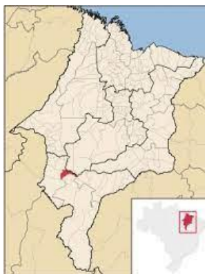
Figura 1 – Localização do Município