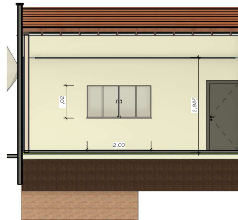
② CORTE 2 1 : 50