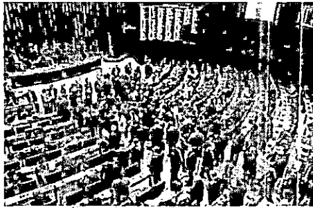
Senado e Câmara promovem sessão conjunta, nesta terça-feira (10), para votar projetos de lei e vetos do presidente Jair Bolsonaro

O primeiro dos dez vetos presidenciais a serem analisados pelos deputados e senadores, na Sessão do Congresso desta terça, é o veto total ao Projeto de Lei 3055/97, que aumenta o limite de renda per capita familiar de quem tem direito ao Benefício de Prestação Continuada (BPC). Pelo projeto aprovado pelo Congresso, o aumento seria de um quarto, limite atual, para meio salário mínimo. Ao vetar esse dispositivo, o governo argumentou que a medida criaria